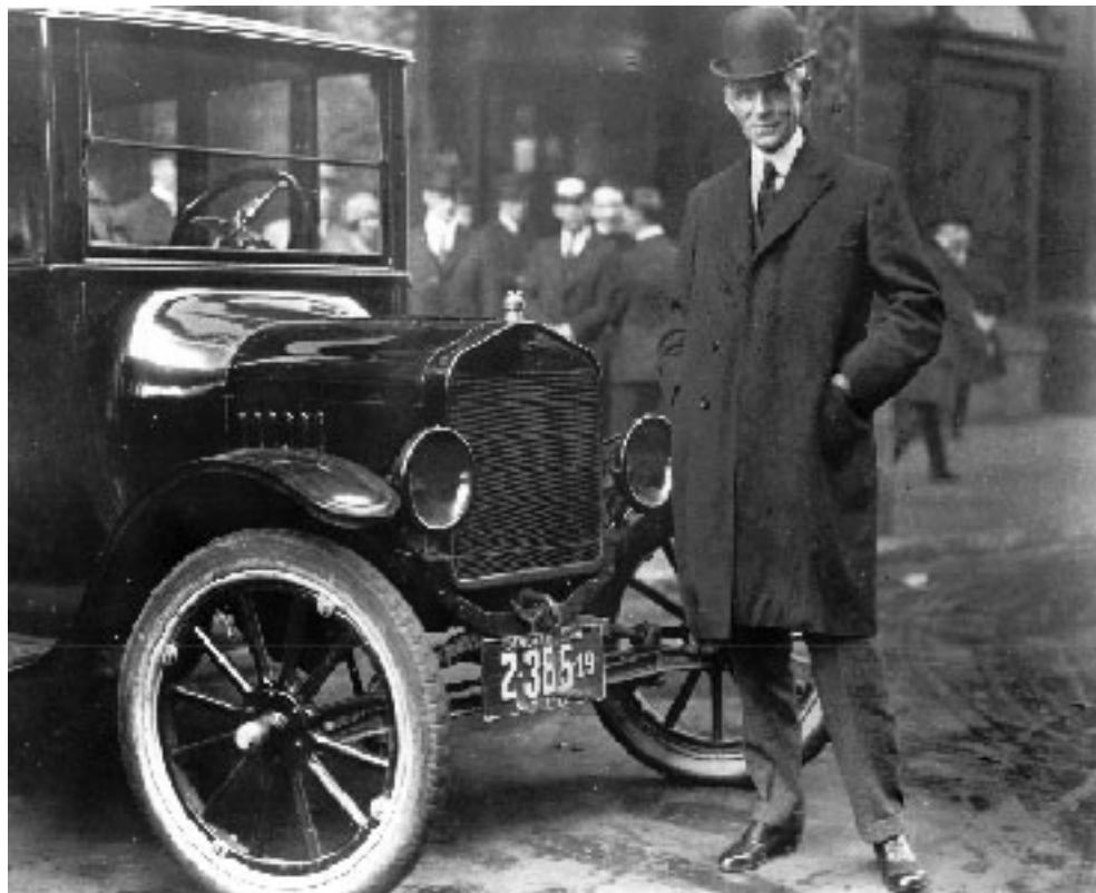
Henry Ford v roce 1921